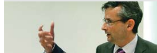
Pierre-André Meyrat, vice-directeur de l'OFT, a rappelé les mécanismes de financement du rail