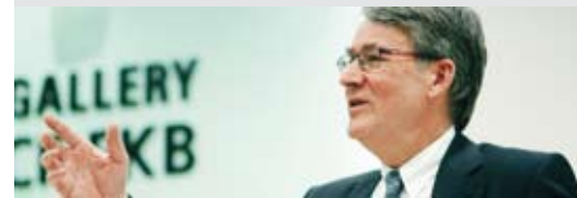
Le vice-président d'OUESTRAIL et Conseiller aux Etats Urs Schwaller a dirigé l'AG jusqu'à la nomination du Conseiller aux Etats Claude Hêche à la présidence d'OUESTRAIL