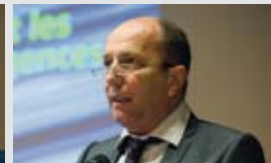
Jean-René Germanier, Conseiller national (VS) pour la vision des Libéraux - Radicaux