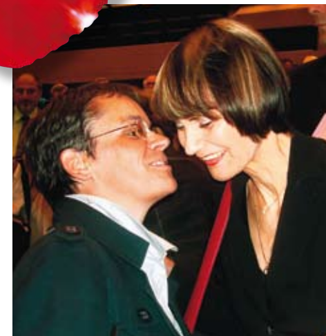
Micheline Calmy-Rey, présidente de la Confédération, en compagnie de Liliane Maury Pasquier au Congrès des Suisses de l'étranger, Genève, le 18 août 2007.