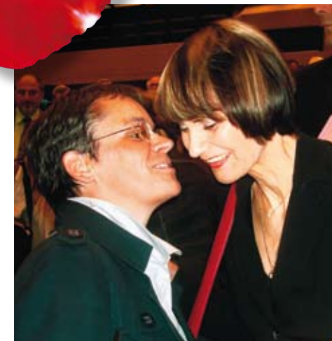
Micheline Calmy-Rey, présidente de la Confédération, en compagnie de Liliane Maury Pasquier au Congrès des Suisses de l'étranger, Genève, le 18 août 2007.